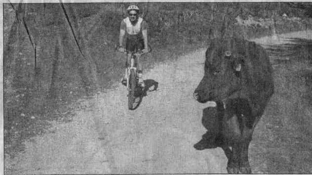
Au détour d'un chemin, lors d'une balade à VTT, on peut parfois faire de drôles de rencontres...