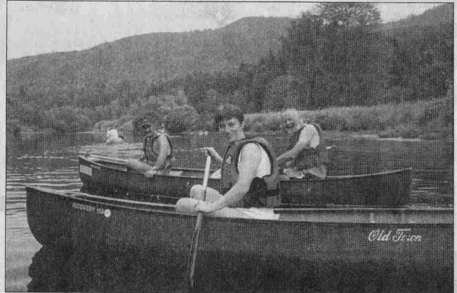
Techniques de navigation et découverte du milieu aquatique, la descente de la Moselle en canoë privilégie la détente et l'enrichissement personnel.